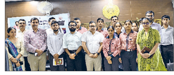
सोनीपत। लघु सचिवालय में विद्यार्थियों के साथ अधिकारीगण।

आंदोलनकारियों का अभिनंदन किया। स्वास्थ्य विभाग तालमेल कमिटी की ओर से विभिन्न संगठनों के पदाधिकारियों ने स्पष्ट कहा कि जियो फेंसिंग आदेश अव्यवहारिक, गैरकानूनी और निजता के अधिकार का उल्लंघन है। कर्मचारियों ने चेतावनी दी कि यदि आदेश तुरंत रद्द नहीं किया गया तो आगामी 7 सितंबर को होने वाली राज्य कार्यकारिणी बैठक में निर्णायक आंदोलन का ऐलान किया जाएगा।