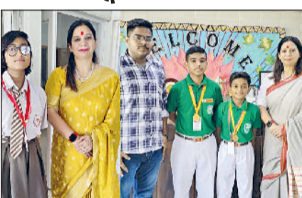
सोनीपत। विजेता खिलाड़ियों के साथ प्राचार्या एवं अन्य।