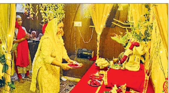
सोनीपत। मॉडल टाउन में गणपति भगवान को नमन करते हुए।