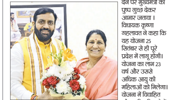
राई। विधायक कृष्णा गहलावत मुख्यमंत्री नायबसिंह सैनी को योजना की सौगात देने पर बधाई देते हुए।

राई। राई हटके की विधायक कृष्णा गहलावत ने महिलाओं के हित में एक बड़ी सौगात की मुख्यमंत्री नायब सिंह सैनी द्वारा प्रदेश दीन दयाल लाडो लक्ष्मी योजना के तहत महिलाओं को हर महीने 2100 रुपये की आर्थिक सहायता देने पर मुख्यमंत्री का पुष्प गुच्छ देकर आभार जताया। विधायक कृष्णा गहलावत ने कहा कि यह योजना 25 सितंबर से ही पूरे प्रदेश में लागू होगी। योजना का लाभ 23 वर्ष और उससे अधिक आयु की महिलाओं को मिलेगा। योजना में विवाहित और अविवाहित दोनों प्रकार की महिलाएं शामिल होंगी। सरकार का उद्देश्य महिलाओं को आत्मनिर्भर बनाना और उनकी आर्थिक स्थिति को मजबूत करना है। यह आर्थिक सहयोग महिलाओं को घरेलू जरूरतों को पूरा करने के साथ-साथ उनके व्यक्तिगत खर्च और आत्मनिर्भरता की दिशा में भी मददगार साबित होगा। उन्होंने कहा कि महिलाओं की भागीदारी के बिना समाज और देश की प्रगति संभव नहीं है। विधायक कृष्णा गहलावत ने कहा कि 'दीन दयाल लाडो लक्ष्मी योजना' महिलाओं के जीवन में सकारात्मक बदलाव लाएगी। माजपा सरकार महिलाओं की कलाई के लिए लगातार योजनाएं चला रही है और आने वाले समय में और भी महत्वपूर्ण कदम उठाए जाएंगे।