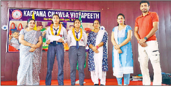
खरखोदा। विद्यार्थियों का स्वागत करते हुए प्राचार्या व प्राथमिक प्रभारी।